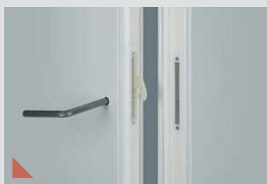
Sammankoppling med excenterlås