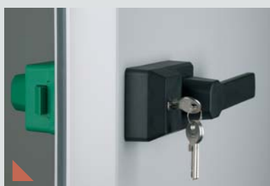
Låsbart handtag med nödöppningsfunktion