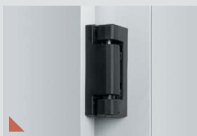
Gångjärn i komposit